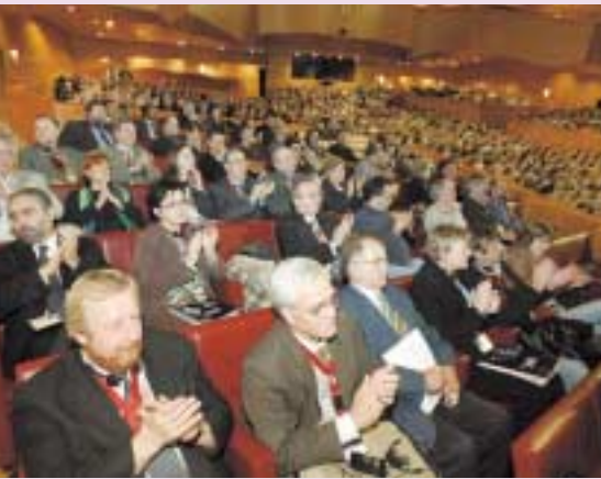
Una amplia delegación internacional acudió al Congreso de ELA. A la derecha, los intervinientes, por orden de participación.