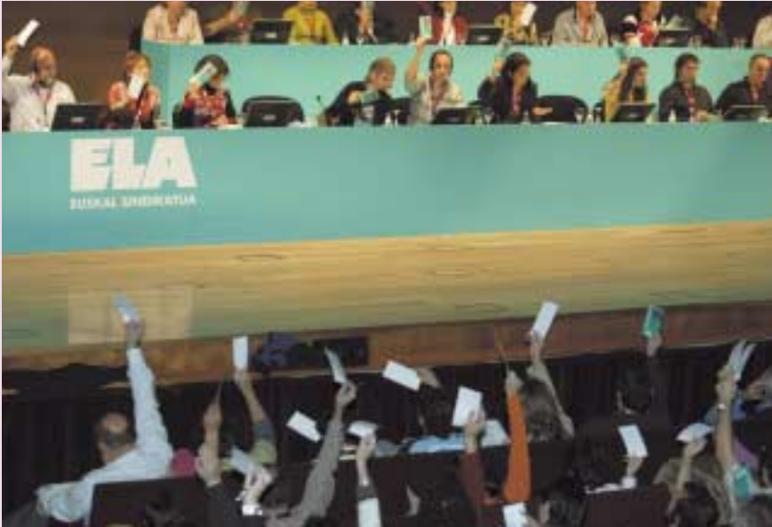
Mesa del Congreso y Mesa de la Ponencia.