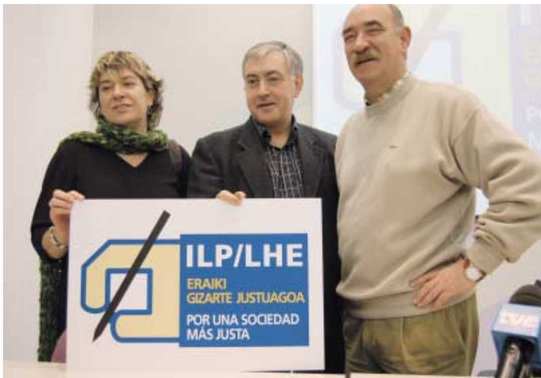
Los máximos responsables de ELA, ESK y STEE-EILAS durante la presentación pública de la campaña sobre un modelo de sociedad.

Las Mesas de los parlamentos de Gasteiz e Iruña no admiten a trámite las ILPs para una carta sobre modelo de sociedad