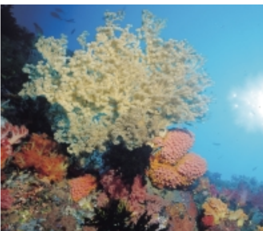
Lolo a punto de realizar una inmersión. Algunas de las fotos realizadas en Indonesia.

keta egiten den zonaldearen ezau- garrietara egokitzen dira. Esatera- ko, txapelketa burutzen den ingu- rua arrainetan oparoa bada, 36 arrain mota ezberdin irudikatzea.