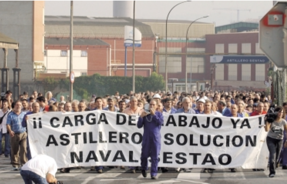
Empresas emblemáticas de Euzkialdea han sufrido y siguen sufriendo profundas reconversiones, y su futuro está en el aire. En la imagen, trabajadores de La Naval, en lucha.